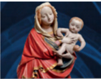
Ke slávě a chvále II Tisíc let duchovní kultury na Moravě Arcidiecézní muzeum Olomouc

ČT | 14. 2. | 18.30 | ARCIDIECÉZNÍ MUZEUM OLOMOUC → VSTUP VOLNÝ Křížová cesta z Orlice | Restaurování 2010–2018