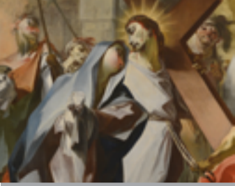
Křížová cesta z Orlice Restaurování 2010-18 Arcidiecézní muzeum Olomouc

ÚT | 12. 2. | 18.30 HODIN | KAVÁRNA MUO - DŘÍVE CAFÉ 87 → VSTUPNÉ 50 Kč Pozvání na skleničku – Osobnosti Olomouckého kraje